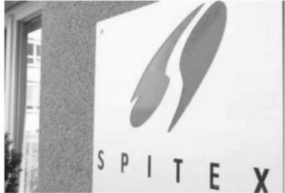
Unter diesem Signet treten künftig vier Spitex-Organisationen der Region als neue Einheit auf.